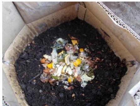
毎日生ごみを入れる