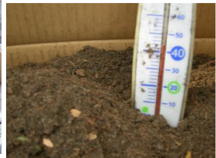
中は60度以上にもなることも